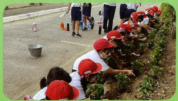
家庭募金緑化事業