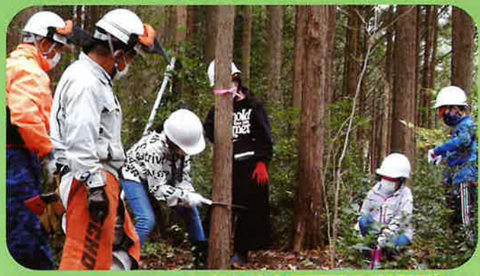
緑の少年団活動(間伐体験)