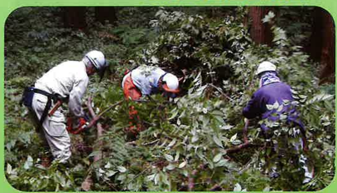
ボランティアによる整備