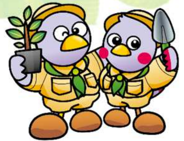
埼玉県マスコット 「コパトン&さいたまっち」

※1 例:植樹祭で使用する移植ごて、飲料水など ※2 例:広告掲示、輸送運搬等の役務の提供