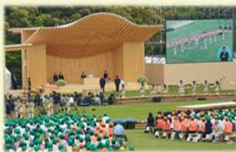
式典行事(第70回愛知県大会)