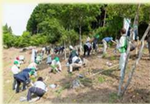
植樹行事(第72回滋賀県大会)