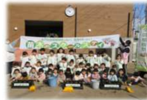
関連事業 (苗木のスクールステイ)