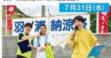
羽ノ浦納涼祭 (川北支部)

◆ 税金クイズ 楽しみながら税に興味を持ってもらおうと地域のイベントに参加し、税金クイズを行いました。