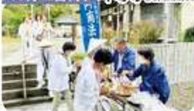
10月16日(水) 平等寺 (阿南南部支部)

管内の四国88ヶ所札所「平等寺」・「太龍寺」・「薬王寺」に於いて、お遍路さんにお茶・おまんじゅうでお接待をし、ポケットティッシュを渡しました。