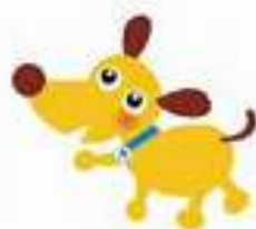
法人会キャラクター きんたくん