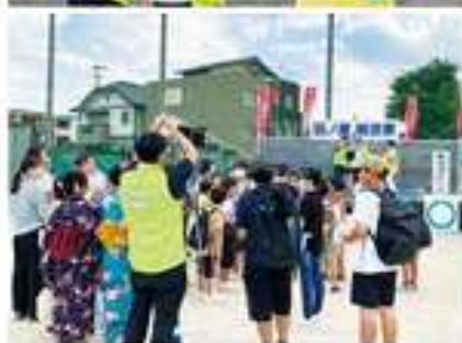
ワンダーふれあい感謝デー (阿南南部支部)