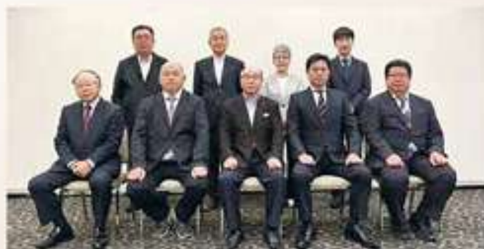
高原署長、六車会長とともに記念撮影が行われました。