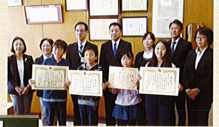
絵はがきコンクールの表彰