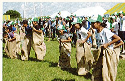
名養クラブ デイキャンプ