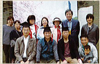
さくらスーパーハカセ