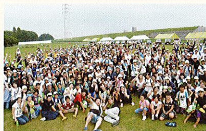
名養クラブ デイキャンプ