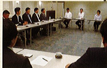
税に関する懇談会