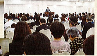
マイナンバー研修会