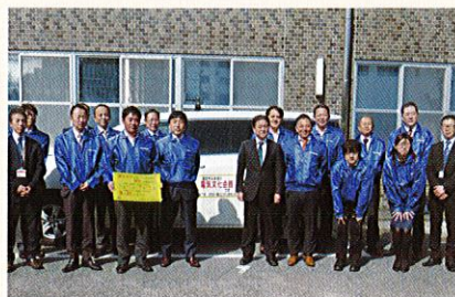
確定申告街頭広報