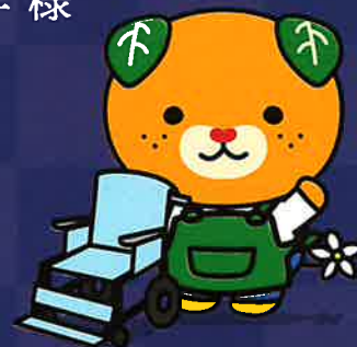
愛媛県イメージアップキャラクター みきゃん