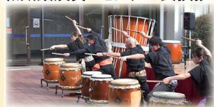
伊豫之二名島扶桑太鼓

先着100名様のうち抽選で20名様に 砥部焼（ヨシュアブルー）フリーカップ 1つプレゼント！