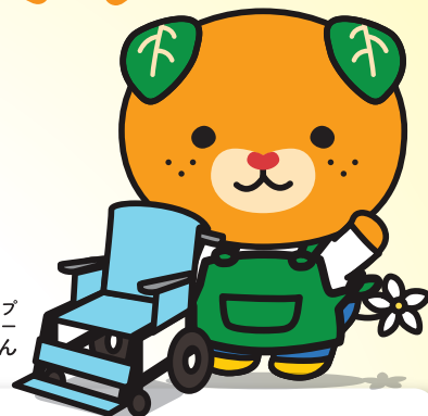
愛媛県イメージアップ キャラクター みきゃん