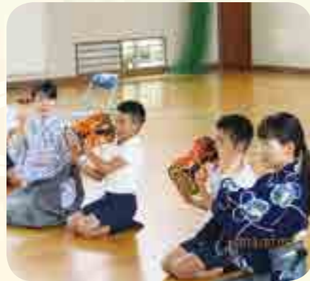
姿勢を正して手首を柔らかく