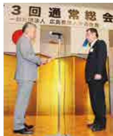
府中法人会が研修高参加率賞を受賞、 角副会長が壇上にて授与