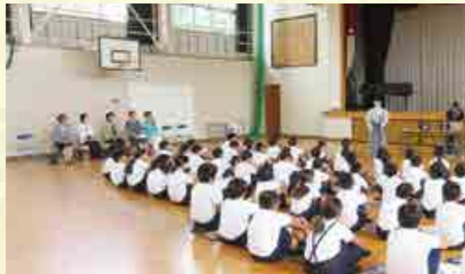
女性部会もお手伝い