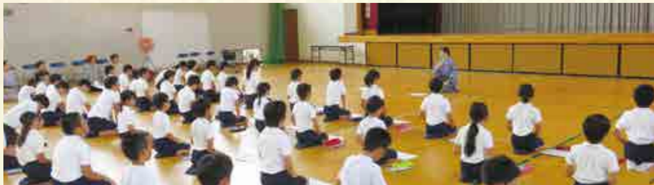
正座にて背筋を伸ばす