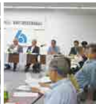
組織・厚生合同委員会