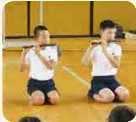
簡単に音が出ない

天狗は牛若丸に戦いの術（兵法）を授けるスケールの大きな存在として描かれています。