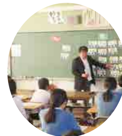
府中市立南小学校租税教室

租税教育委員会が講師を担当し、小学校 6 年生はマグネットを使用して、税金が『使われているもの』、『使われていないもの』に区分して、税金の無い世界ではどうなるかをイメージすることを学習に取り入れる。 中学校 3 年生は、過去の公立高校の入試問題をクイズにして、正解したグループに賞金（模擬紙幣）を出し、獲得した賞金（所得）に課税税率を掛けて所得税の確定申告を行い、賞金の中から納税をする体験をしてもらう。