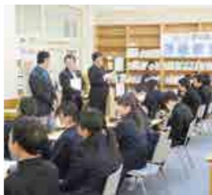
上下中学校租税教室