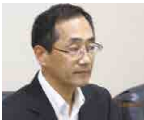
府中税務署 若林 雄二 署長

平成 27 年 7 月 10 日発令の定期人事異動により、府中税務署長に若林 雄二様が着任されました。 (旧官職 東京審判所第二部第3部門主任審判官)