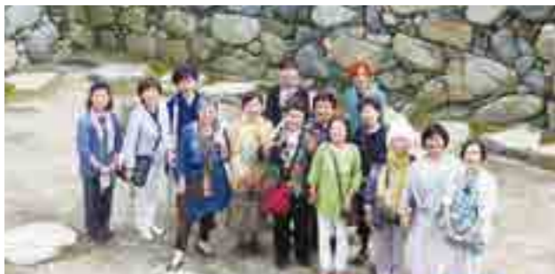
高松城天守閣跡にて