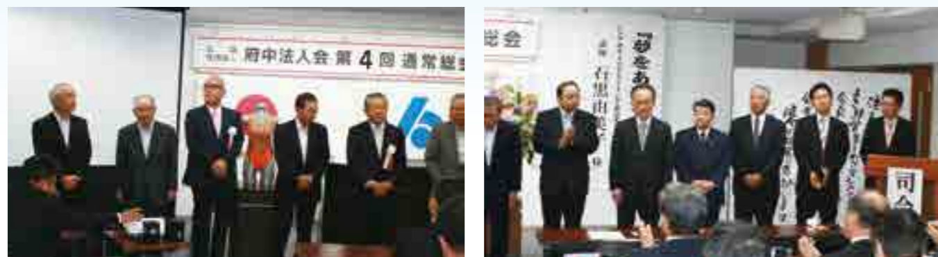
役員改選により選任された貝原会長他副会長4名、常任理事、監事の方々