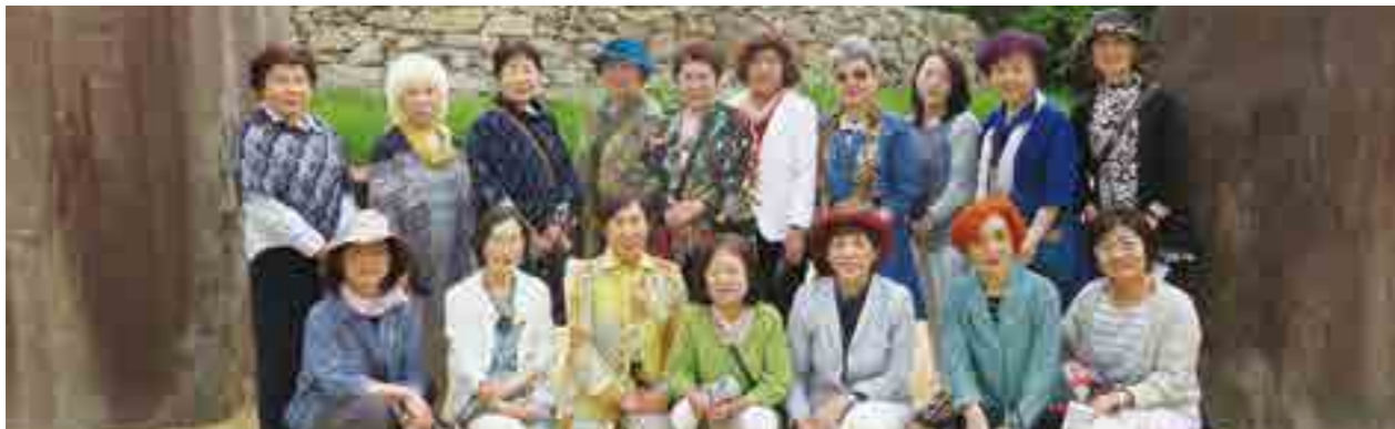
イサムノグチ庭園美術館にて

平成 27 年 5 月 14 日（木）総会及び研修視察旅行で香川県に行きました。総会を『五風十雨』で行いイサム・ノグチ庭園美術館や玉藻公園（高松城跡・陳列館）を視察しました。