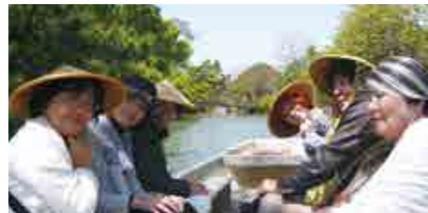
柳川下り(福岡大会)