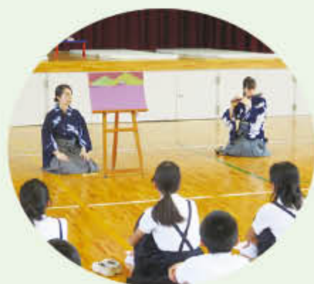
紙芝居によりストーリーを学びました。