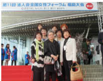
メイン会場(ビッグパレットふくしま)

平成 28 年 4 月 14 日 (木) ビッグパレットふくしまにて、全国より 1,600 名が参加して盛会に行われました。