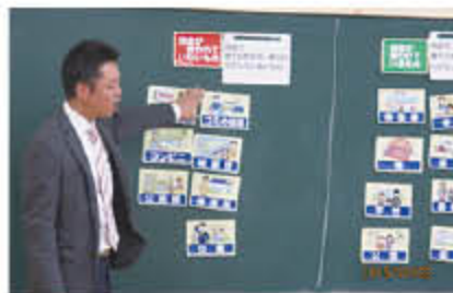
本当に正しいかな～