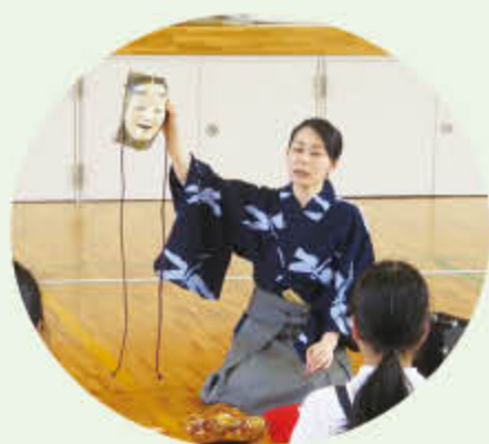
能面の表情は見る角度により変わります。