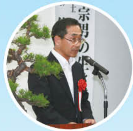
府中税務署長祝辞