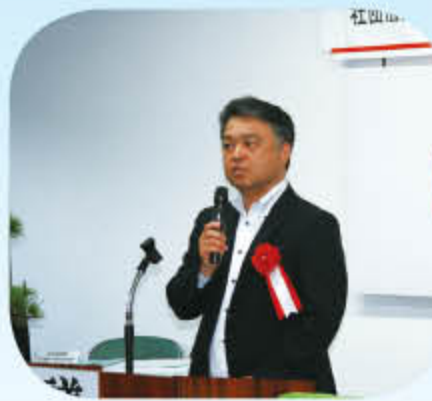
成智統括消費税の説明