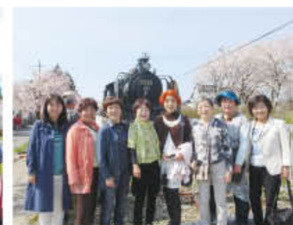
日中線記念自動車歩行者道