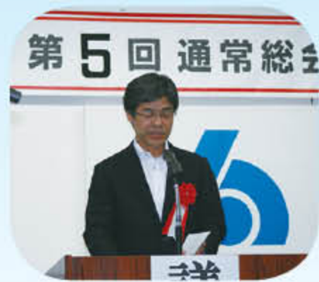
広島県東部県税事務所所長 祝辞