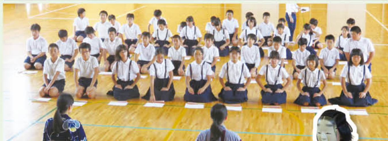
初めての練習、背筋を伸ばして聞きました。