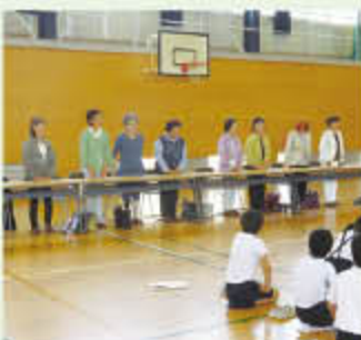
女性部会もお手伝い