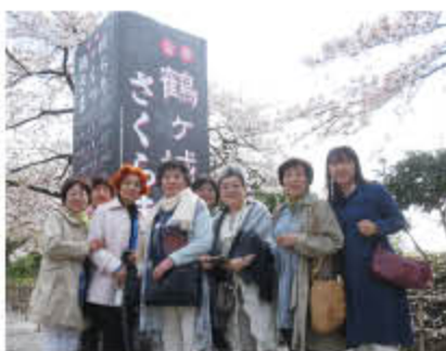
会津鶴ヶ城さくらまつり