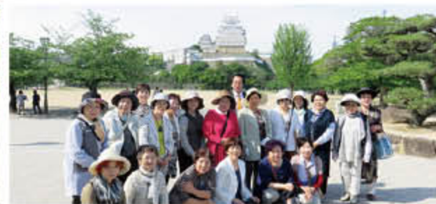
世界文化遺産 国宝 姫路城三の丸にて