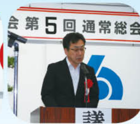
府中市総務部税務課長 祝辞