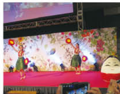
懇親会セレモニー