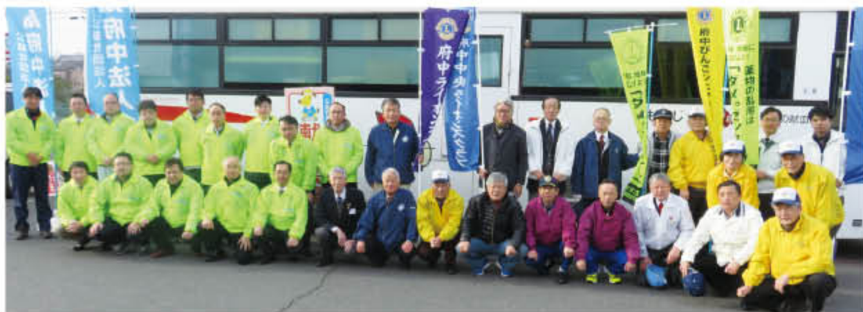
6地区ライオンズに協賛を頂く

血液はどういう時に使われるのでしょうか? 多くは、がんなどの病気の治療で継続的に使われています。 そのため、血液は常に必要とされているのです。