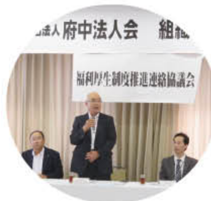
組織・厚生合同委員会