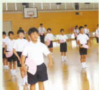
少し形になってきました。