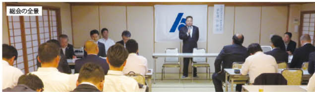
府中法人会 青年部会の総会が 6 月 13 日（月）『くわぎ』にて開催。平成 28 年度の事業計画等が示されました。