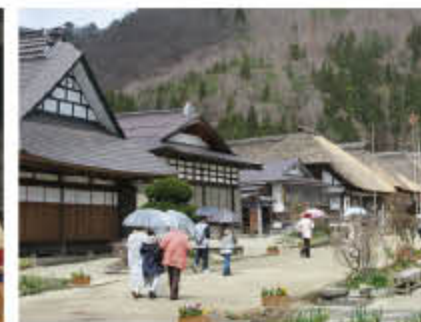
国重要伝統的建造物郡保存地区 大内宿