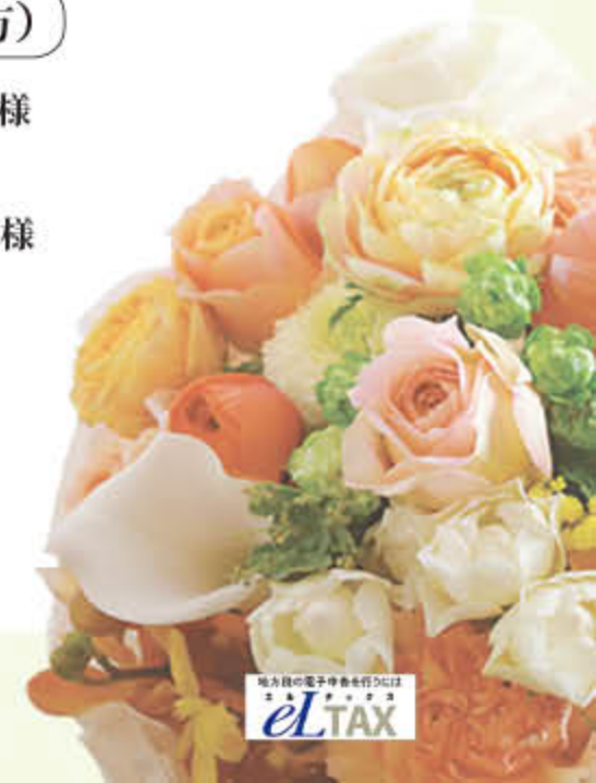
光成 猛 様 備備後燃糸備