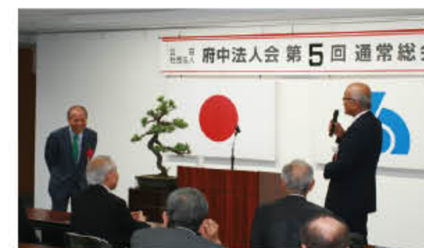
甲斐副会長の謝辞