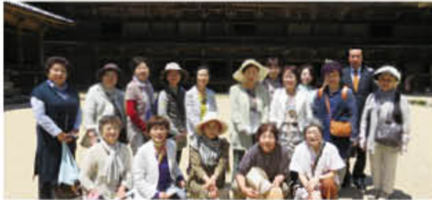
書寫山圓教寺 食堂