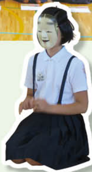
本物の能面をつけて緊張しました