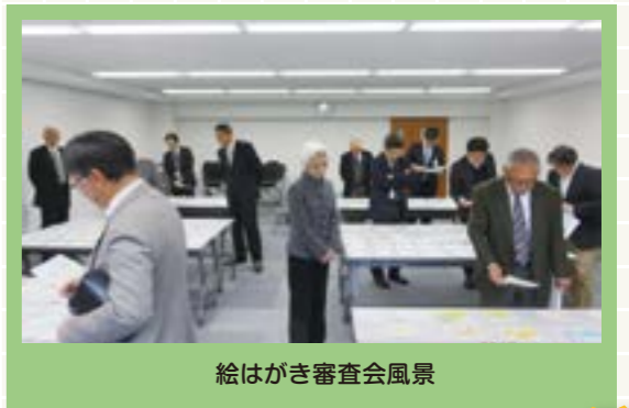
絵はがき審査会風景