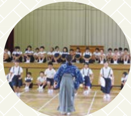
夏の暑い中体育館で練習