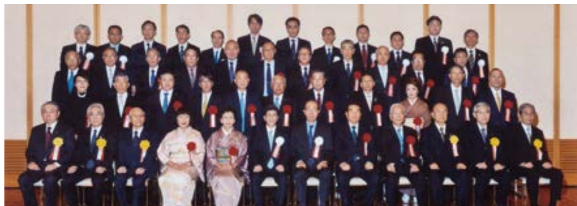
(平成29年10月25日(水) 東京都港区三田共用会議所にて)