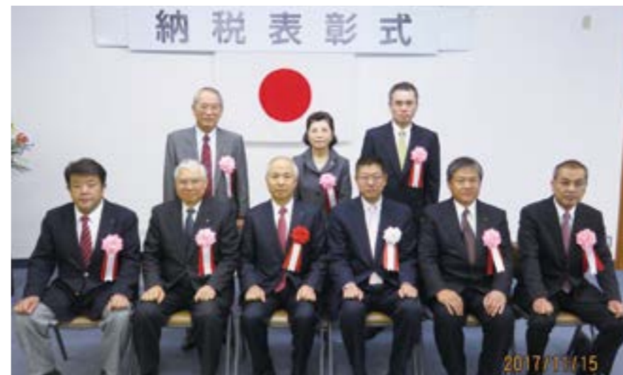
(平成29年11月15日(水) 府中商工会議所会館にて)