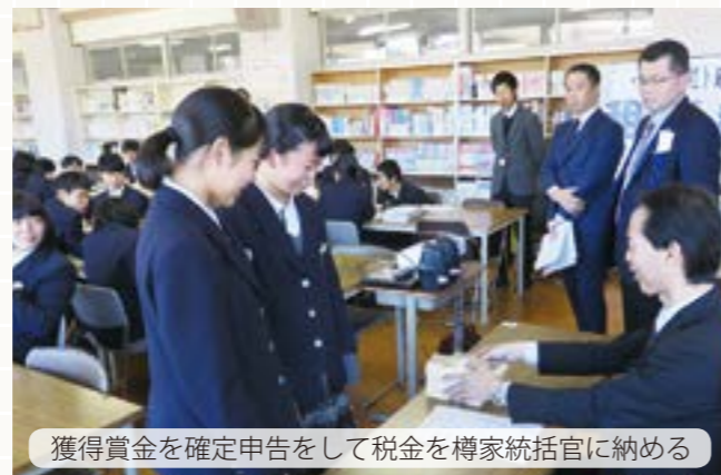
獲得賞金を確定申告をして税金を専家統括官に納める