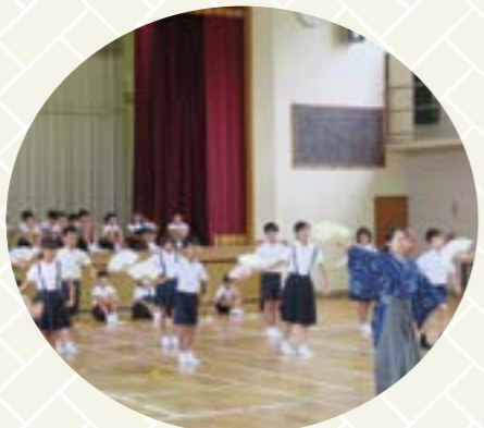
「形」が出来てきた様子