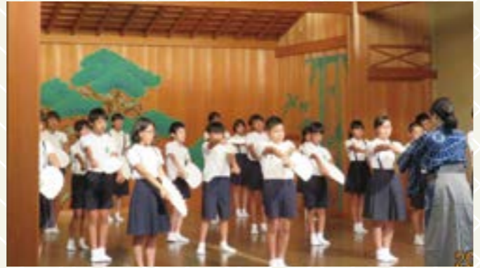
能楽堂での晴れ舞台