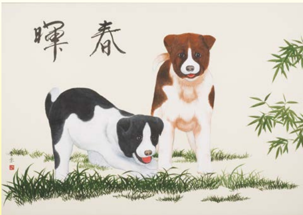
亀山 秀景画伯 素盞鳴神社 奉納絵馬