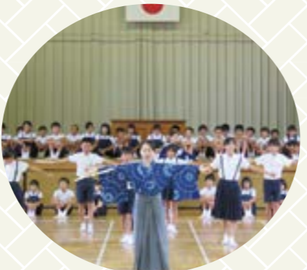
5か月間の長期練習