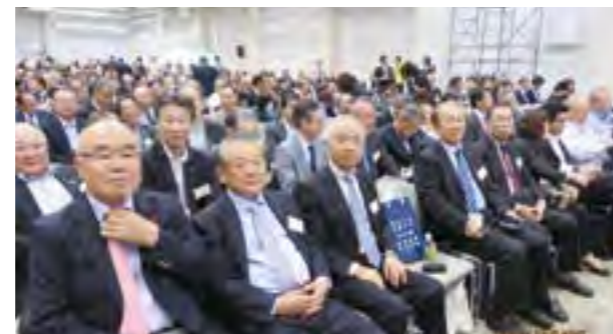
全国大会会場にて