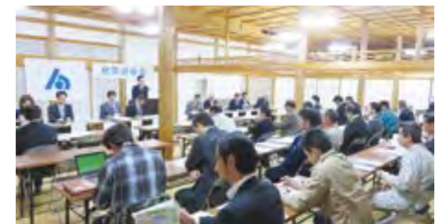
神石高原支部研修会