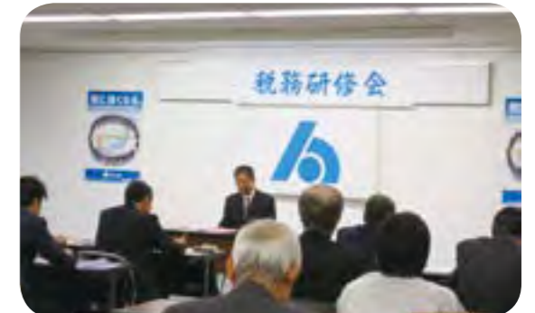
府中東西支部研修会