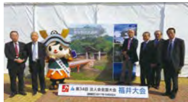
福井県産業会館 (大会会場)