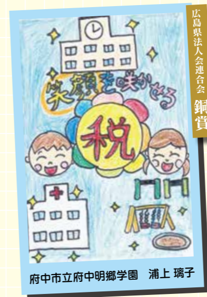
広島県法人会連合会 銅賞