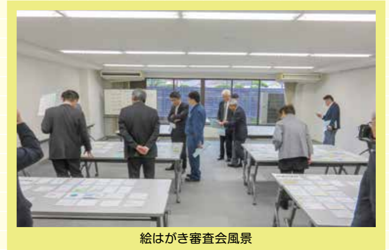
絵はがき審査会風景