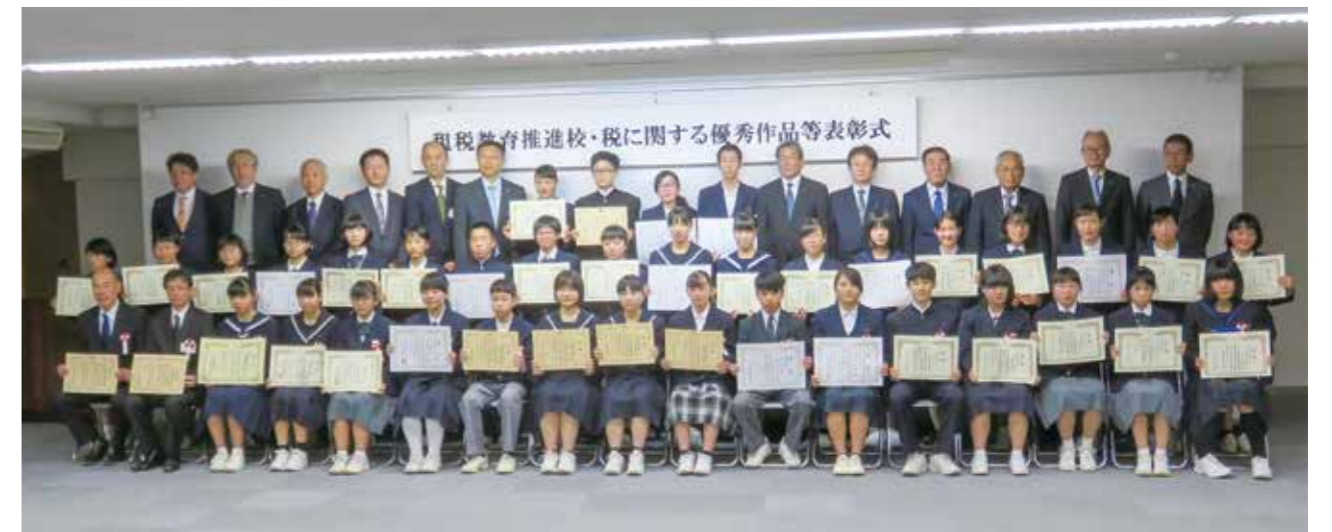
租税教育推進校等・租税優秀作品表彰