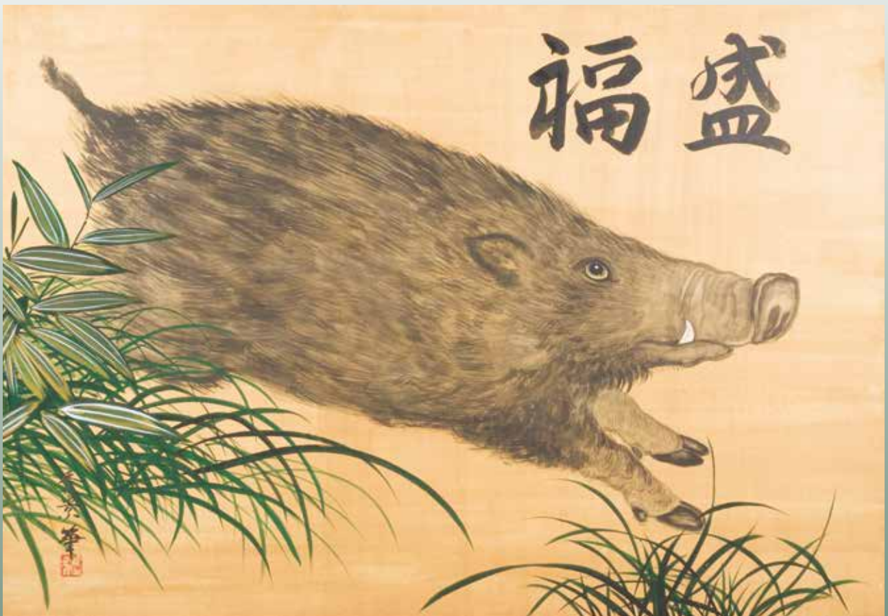
亀山 秀景画伯 素盞鳴神社 奉納絵馬