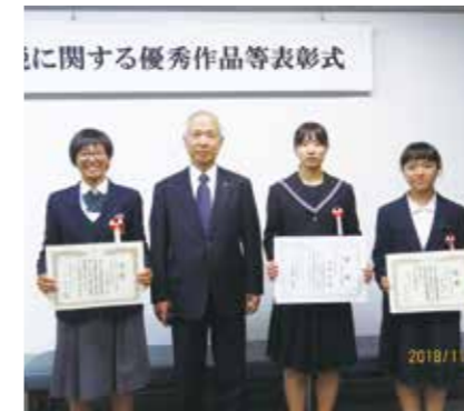
法人会会長表彰者の3名

全国納税貯蓄組合連合会 主催の「作文」・「習字」 全国間税会総連合会 主催の「税の標語」