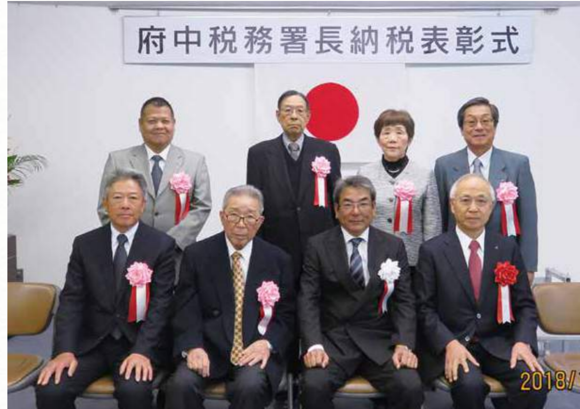
(公社)府中法人会より府中税務署長表彰1名、府中税務署長感謝状4名の方々が受賞されました。

平成30年度 納税表彰式 (平成30年11月15日(木) / 府中商工会議所1階ホールにて)