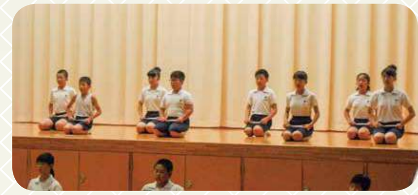
発表会リハーサル

25人のかけがえのない友人と謡い、舞う。 この宝石の様にかがやく時間。 一生わすれることができない思い出となるだろう。