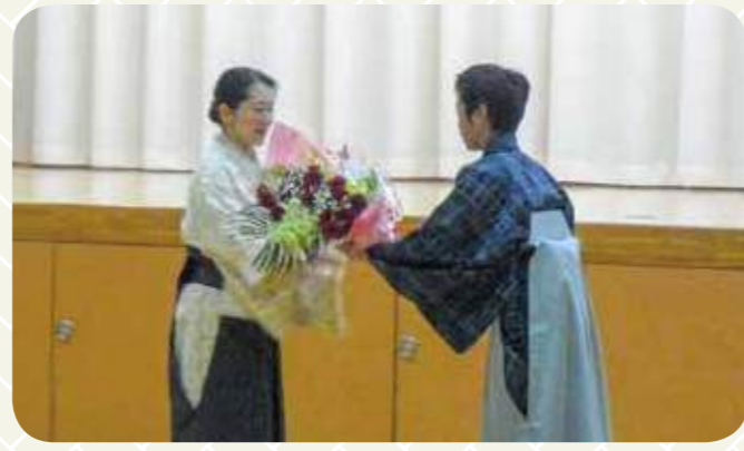
ご指導有難うございました。