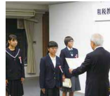
法人会会長賞の授与