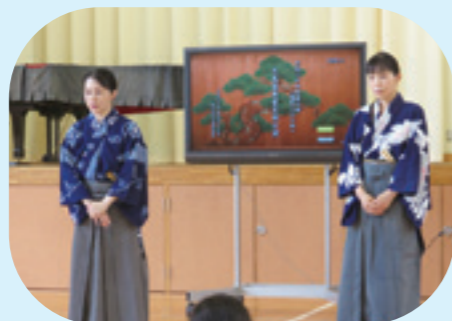
はじめに能楽の歴史等説明