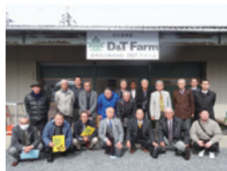
農業法人(株)D & Tファーム

平成31年2月8日（金）農業法人株式会社D&Tファーム（岡山県岡山市南区）を支部会員16名が見学、自社生産の皮まで食べられる「もんげーバナナ」は革新的なビジネスモデルとして注目されている様子を視察しました。