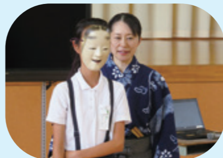
実物の能面をつけて体験（横が見えない〜）