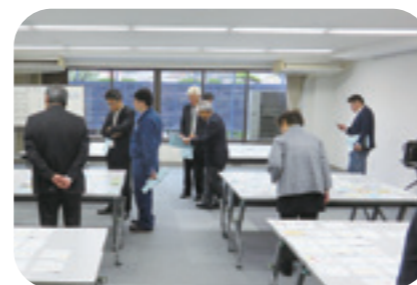
絵はがきコンクール審査風景