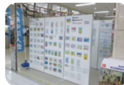
作品を府中天満屋へ展示して披露