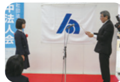
府中税務署長表彰