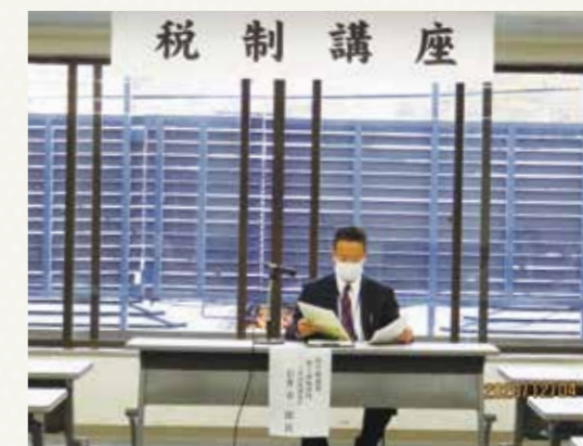
【税目：相続・贈与税】 令和2年 12月4日(金) 府中商工会議所会館にて