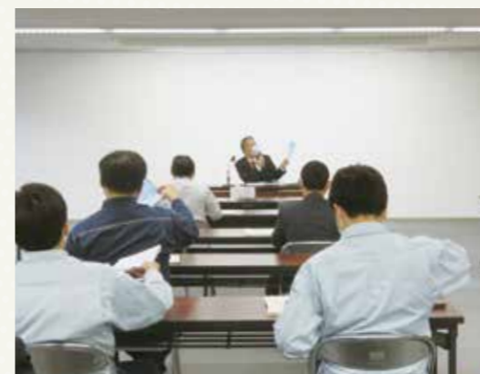
令和3年 3月5日(金) 府中商工会議所会館にて