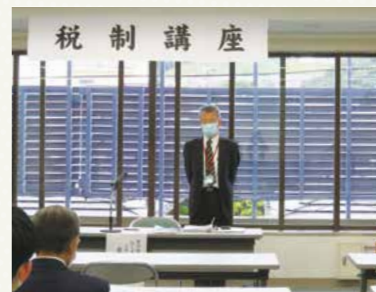
【税目：法人税】 令和2年 10月9日(金) 府中商工会議所会館にて