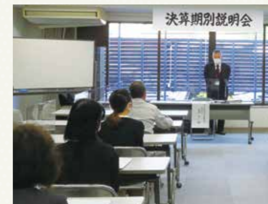
令和3年 4月23日(金) 府中商工会議所会館にて