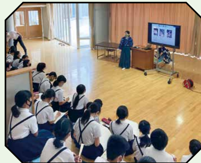
はじめに能楽の歴史等説明