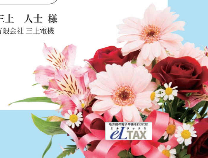
三上 人士 様 有限会社 三上電機