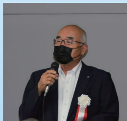
甲斐副会長 閉会の挨拶