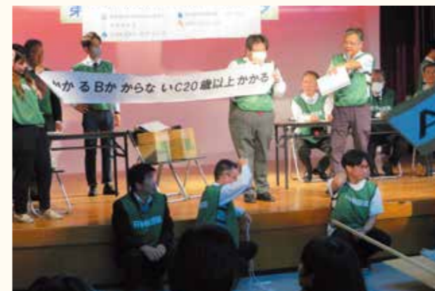
A.とり税、B.かえる税、C.うさぎ税 本当にあるの?