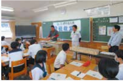
神石高原町立神石高原中学校