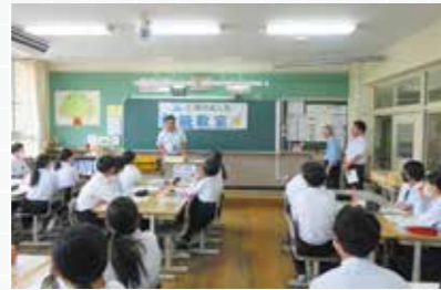
府中市立上下中学校