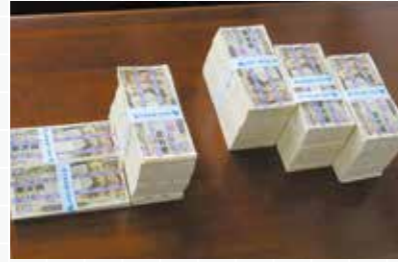
右が獲得賞金30,000,000円 左が納税金12,000,000円