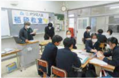
福山市立新市中央中学校

中学校の3年生は受験を控え高校入試問題(過去出題された税金関係)をクイズ形式にて出題しグループで協議して回答、正解したグループに模擬紙幣を賞金として提供。獲得した賞金の合計額を総所得として確定申告をして賞金額から納税をする。(模擬体験版)