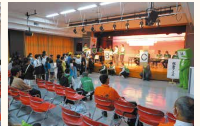
みんなが相談して正解を出しました

全国各地の女性部会が主体となり、小学生を対象に税をテーマにした絵はがきコンクールを実施しております。