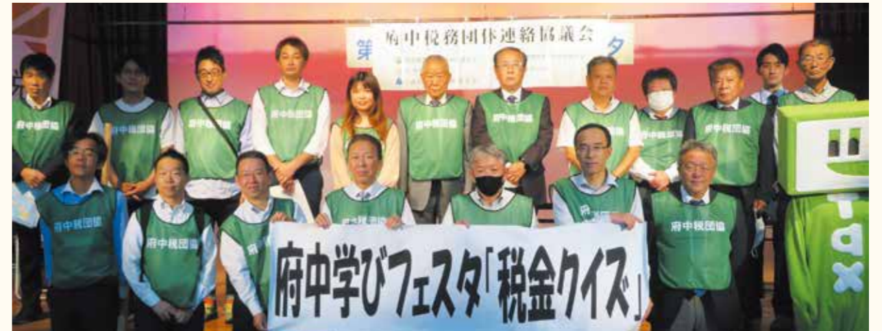
ジーベックホール(府中市文化センター)にて開催