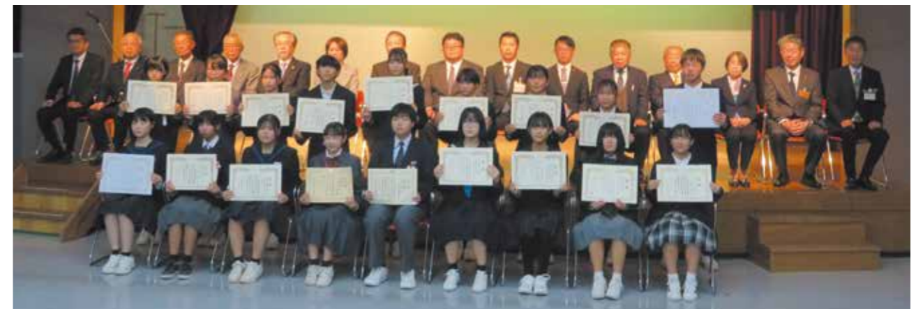
租税教育推進校等・租税優秀作品表彰