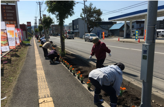
6/6 植樹帯へ花植のボランティアサポート