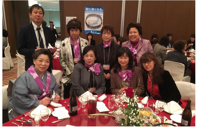
11/14 「税を考える週間」特別講演会