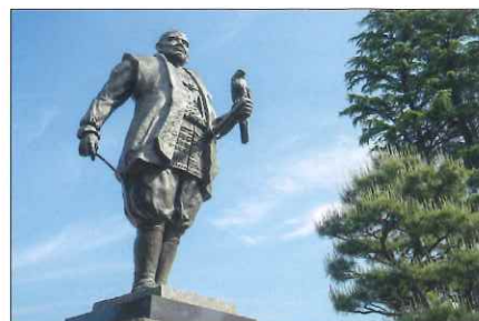
徳川家康公之像（駿府城本丸跡）

2023年NHK大河ドラマ「どうする家康」で主人公として描かれる徳川家康。戦国乱世を終わらせ、天下を太平に導き、徳川家を260年繁栄させた人物に令和時代を生きる私たちは何を学ぶべきか。戦国時代の最後の勝者となった家康の理念、戦略、組織づくり、そして事業承継について、現代の経営のヒントをお伝えします。