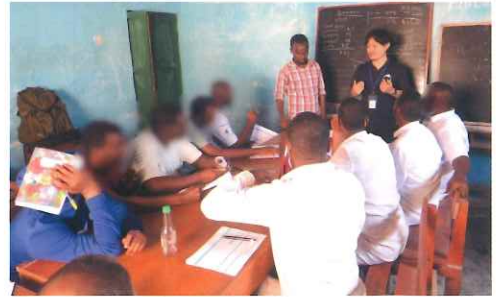
写真：ソマリアの刑務所でのワークショップの様子

「誰しものが平和の担い手となり、共に憎しみの連鎖をほどいていく」をパーパスに掲げ、アフリカの紛争地で平和構築、紛争解決に取り組むNPO法人アクセプト・インターナショナル。そこで約7年半の海外平和活動を経た講師が事例と共に日本から平和の輪を広げる意義を語ります。