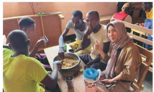
写真：ソマリアの刑務所で一緒に食事をする様子

アフリカの紛争地で元テロリストの脱過激化と社会復帰支援に取り組んできた講師は「戦略的対話」を用いて彼らと対話を重ねてきました。この「戦略的対話」はマネジメント層とZ世代間のギャップ解消にも役立ちます。紛争地という対話すら困難な場所で培われた対話のヒントをお見逃しなく！