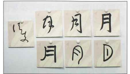
※セミナー動画より