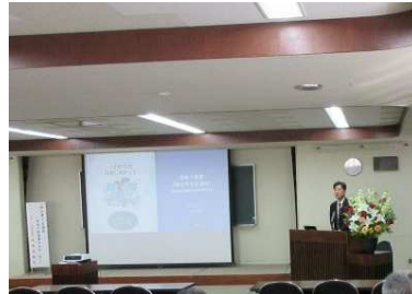
税を考える週間の事業として税務署長講演会を実施