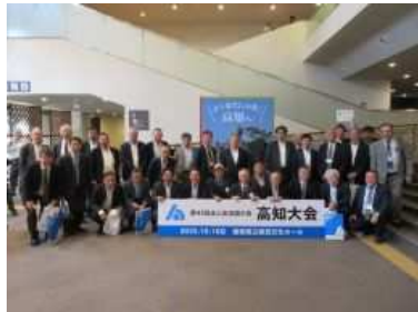
全体参加者 1600名／当会 2名 令和8年度税制改正スローガン