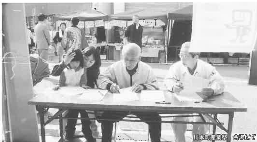
川本町産業祭 会場にて

本年も各地のイベントや祭りに合わせ「税金クイズ」を開催しました。今回もクイズ問題の作成には浜田税務署・西部県民センター・浜田市役所・江津市役所・川本町役場のご協力をいただきました。各支部事務局と商工会のご協力を頂き、11月4日、川本町産業祭、11月11日、桜江町祭り、旭町ふるさとまつり、21日には江津商工会議所優良従業員表彰式の4会場において開催いたしました。あわせて参加賞として法人会けんたくんグッズのタオルハンカチにe-TAXの推進パンフレットを同封したものを350枚準備し、当日配布しました。クイズの参加者は前年より会場が1か所少なかったため150名でした。