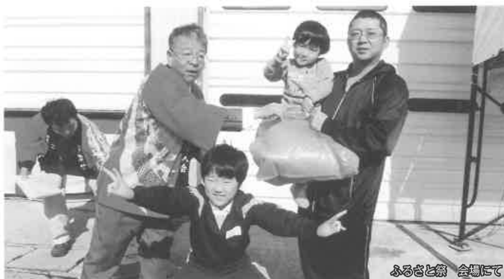
ふるさと祭 会場にて