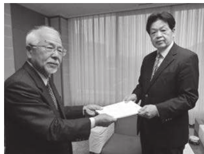
写真右から 川神浜田市議会議長、今井税制委員長