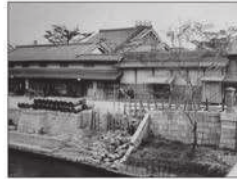
大同生命の礎を築いた 大坂の豪商「加島屋」