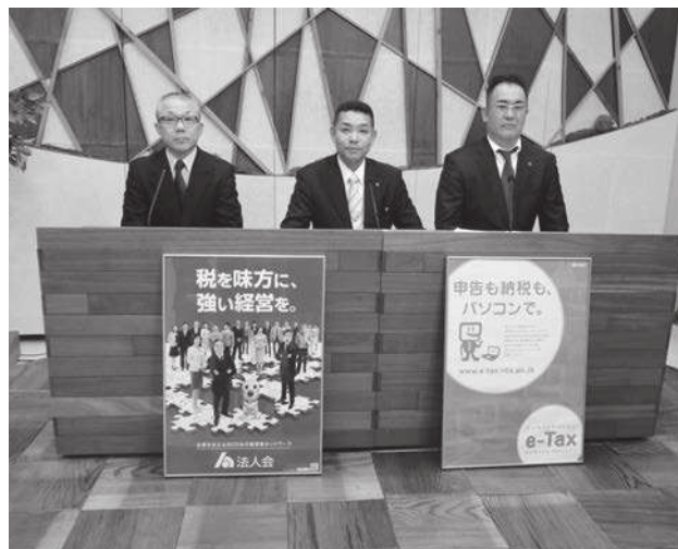
解答編の収録風景