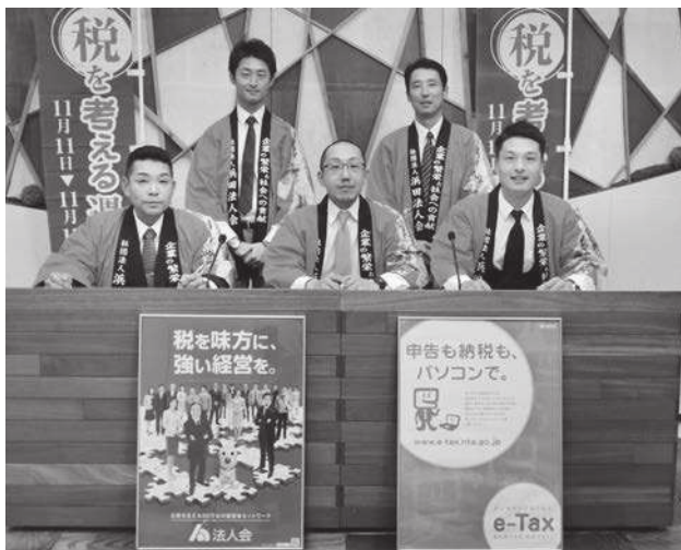
応募編の収録風景

又、浜田税務署法人課税部門統括国税調査官と前澤青年部会長による厳正なる抽選により本年度の入賞者を決定し、放送しました。