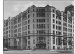
旧肥後橋本社ビル (設計:W・M・ヴォーリス)