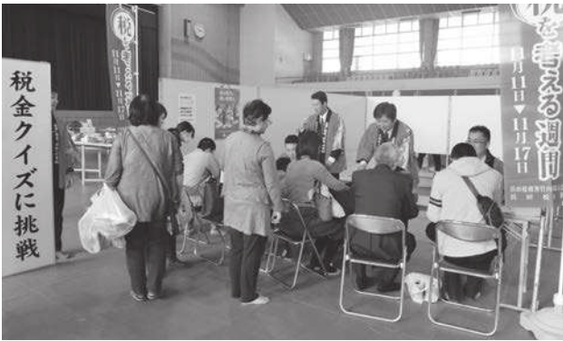
さざんか祭り（金城）

本年も各地のイベントや祭りに合わせ「税金クイズ」を開催しました。税金クイズの問題作成には、浜田税務署・浜田市役所・江津市役所・川本町役場のご協力をいただきました。青年部を中心に各支部事務局と商工会のご協力を頂き、11月3日さざんか祭り（金城）、11月4日川本町産業祭、11月11日旭ふる里まつり、11月30日には江津商工会議所優良従業員表彰式など4会場において開催いたしました。税金クイズの参加賞として、法人会けんたくんグッズのボールペンや蛍光ペン等を準備し当日配布しました。クイズの参加者は、今年は天候にも恵まれ、延べ人数371名の方々に参加頂きました。