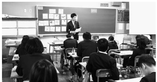
松原小学校での租税教室