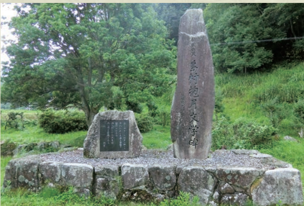
浜田市 島村抱月文学碑公園 (浜田市金城町久佐イ108)