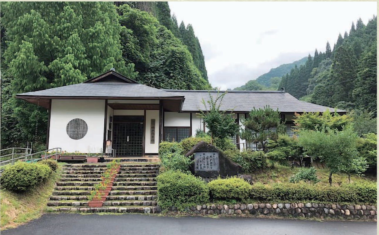
美郷町 斎藤茂吉 鴨山記念館 (邑智郡美郷町湯抱265-1)