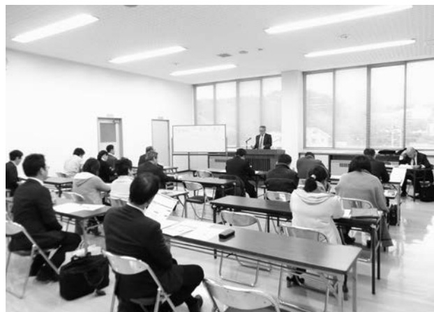
江津支部税務研修会