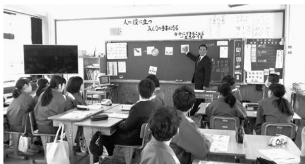
瑞穂小学校での租税教室