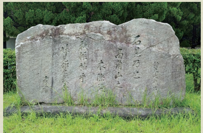
江津市 柿本人麻呂歌碑 (江津市都野津町1750)