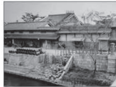
大同生命の礎を築いた 大坂の豪商「加島屋」