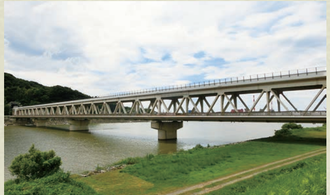
新江川橋 (しんごうがわばし)

1階が市道、2階が国道9号バイパスという山陰地方で最初のダブルデッキの橋梁で、全長は378m。平成5年開通。