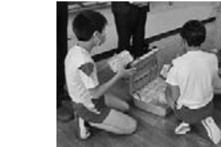
取る児童 1億円の 見本を手に

全法連青連協では、租税教育活動、部会員増強運動と並ぶ部会活動の3本目の柱とすべく、「財政健全化のための健康経営プロジェクト」の全国的な取り組みをスタートし、「ジェネリック医薬品の利用促進」や「健康経営宣言書の提出と宣言内容の実践」といった具体的な活動を推進しております。