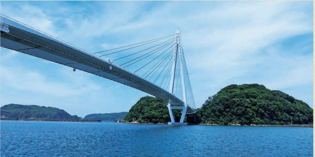
浜田マリン大橋 (はまだまりんおおはし)

構造は斜張橋で、漁港施設の斜張橋としては、国内最長の305m（取付部を含めた全長は615m）を誇り、塔の高さは海面から約92mにもなる。平成11年開通。