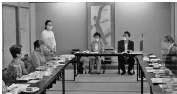
女性部年次大会の様子