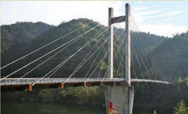
美郷町 高梨大橋 (たかなしおおはし)

江の川に架かる唯一の斜張橋で、国内の斜張橋の中では、29番目に完成。昭和59年開通。