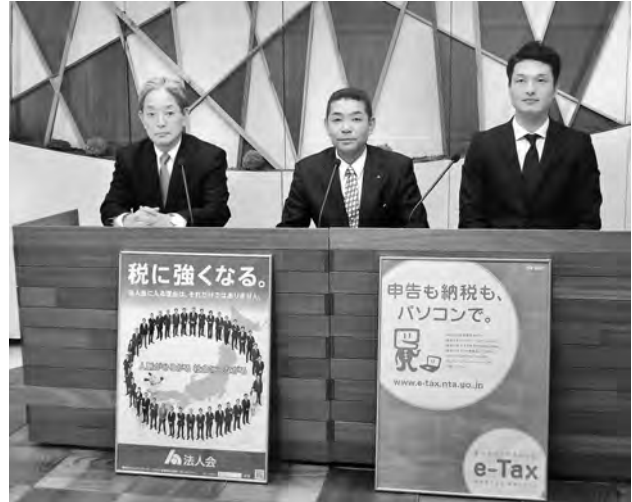
解答編の収録風景