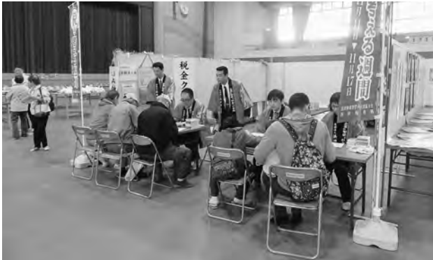
さざんか祭り（金城）

本年も各地のイベントや祭りに合わせ「税金クイズ」を開催しました。税金クイズの問題作成には、浜田税務署・浜田市役所・江津市役所・川本町役場のご協力をいただきました。青年部を中心に各支部事務局と商工会のご協力を頂き、11月4日さざんか祭り（金城）、11月5日川本町産業祭、11月12日旭ふる里まつり、11月28日には江津商工会議所優良従業員表彰式など4会場において開催いたしました。税金クイズの参加賞として、法人会けんたくんグッズのボールペンとメモ帳等を準備し当日配布しました。クイズの参加者は、今年は天候にも恵まれ、延べ人数329名の方々に参加頂きました。