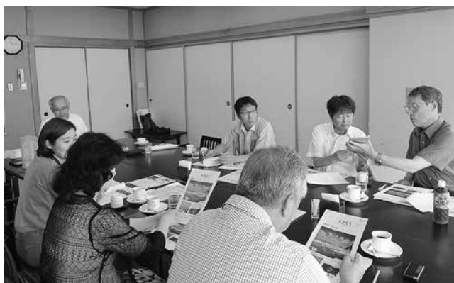
紙面の内容やタブレットで表紙の色合いを協議

毎回会員の皆様にタイムリーでお役に立つ記事を書き載せようと奮闘しております。来年9月の広報誌は第100号の記念誌になります。皆様からのアイデアも募集します。奮ってご参加下さい。