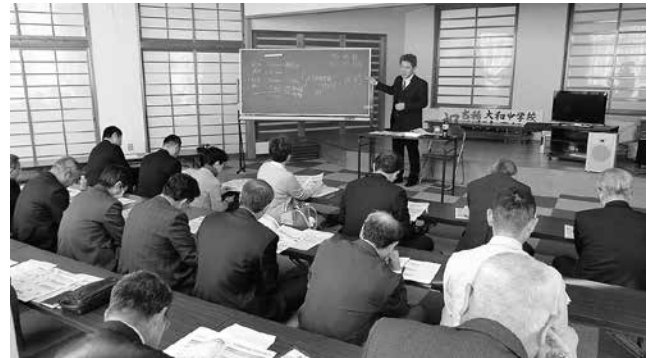
邑智支部税務研修会