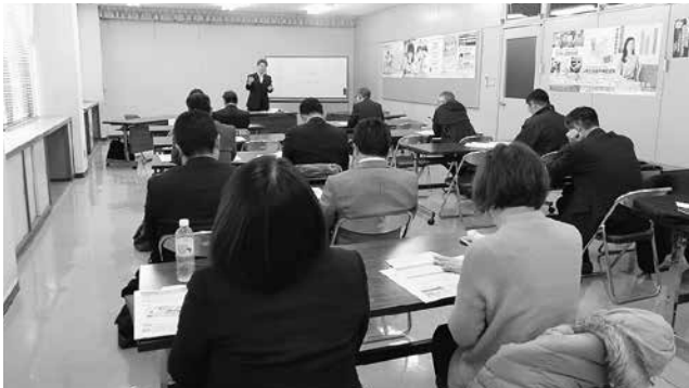
江津支部税務研修会

支部税務研修会では、浜田税務署の勝部法人課税部門統括国税調査官が講師となり、「消費税の軽減税率制度について」を主題に、お話を頂きました。