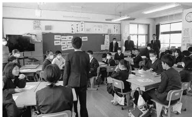
瑞穂小学校での租税教室