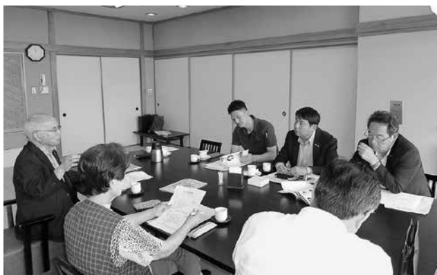
研修会や講演会について真剣に協議