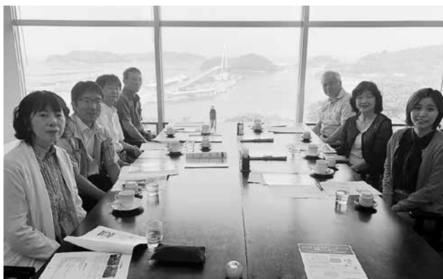
協議を終えた後の充実感