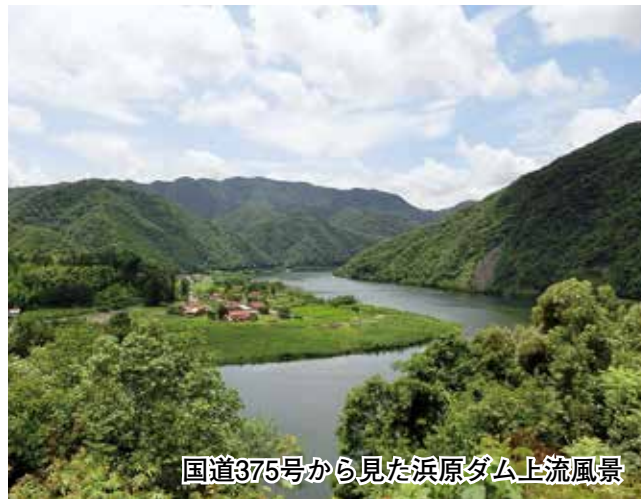
国道375号から見た浜原ダム上流風景