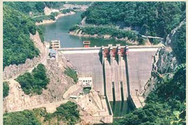
江津市 八戸ダム (江津市桜江町八戸1661-55)