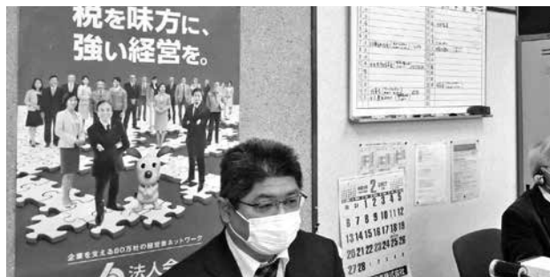
浜田支部税務研修会（法人会事務局）