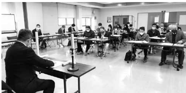
邑智支部税務研修会（邑南町商工会）

浜田法人会では初めて、浜田法人会事務局からWEB方式による研修会を開催し、この経験は6月3日開催の青年部理事会でも活用、今後もWEB方式の対応を進めてまいります。