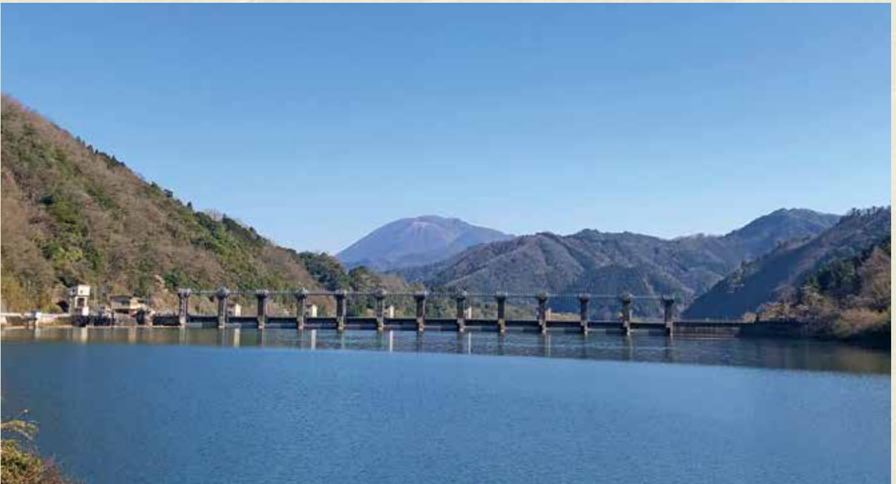
美郷町 浜原ダム (邑智郡美郷町浜原)