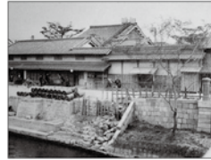
大同生命の礎を築いた 大坂の豪商“加島屋”