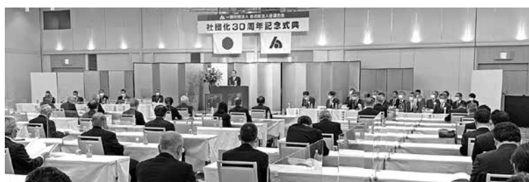
社団化30周年式典の様子