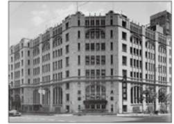
旧肥後橋本社ビル (設計:W・M・ヴォーリス)