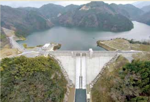
浜田市 第二浜田ダム (浜田市河内町1952-2)