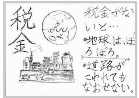
江津市立桜江小学校 ジャワード ジュバエル アル