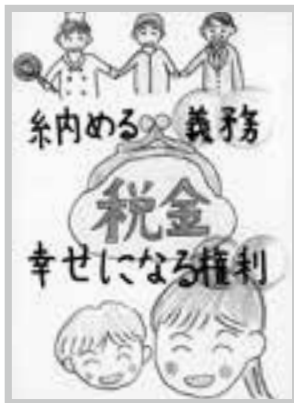
邑南町立石見東小学校 天津 兼継

租税作品819作品は、11月11日から11月17日まで下記の場所で展示されました。