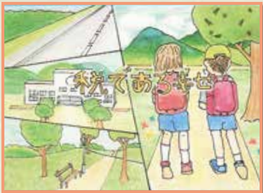
邑南町立市木小学校 笠岡 鈴