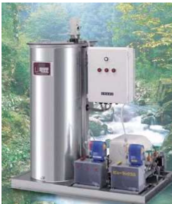
沢の水専用小型浄水装置 デバクター

さらに、「地震対策用の浄水装置はできないか」という要望に応えるために、緊急時浄水装置を開発・販売を始め、これをきっかけとして防災用品の取り扱いも始めました。DASCO式緊急時浄水装置は発売から45年以上経過した現在、自治体を中心に10,000台以上を納入。全国トップクラスの販売実績を誇っています。