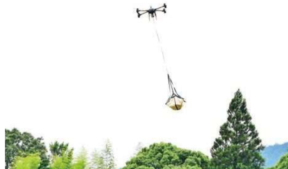
ドローンによる物資の運搬

もともと個人事業でクレーンオペレーターとして、橋梁や建設現場、災害対策の現場などで、30年以上働いてきた経験が、ドローン事業に生かされています。