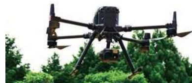
赤外線カメラによる 建物の外壁点検