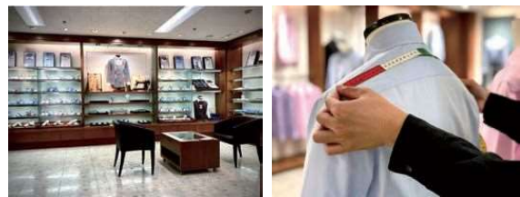
静岡伊勢丹 5F 「SEIWA」

2022年には静岡文化芸術大学に綿や絹、麻をはじめ、デニムやチノパン向けの生地を無償で提供し、服飾イベント「纏う展」を支援。さらに現在では、素材の国際見本市「ミラノウニカ」の日本ブースへの出展を目指して活動中とのこと。新たな販路を開拓すべく意欲的に活動されています。