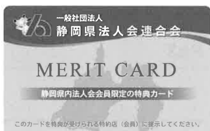
法人会メリットカード

特典をご利用になる会員には、「法人会メリットカード」「富士山入り法人会バッジ」「メルマガ受信画面」等の提示を求めて、会員であることをご確認ください。