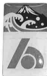
富士山入り 法人会バッジ