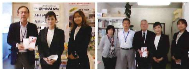
宿毛市社会福祉協議会様へ 大月町社会福祉協議会様へ

部会員の交流だけでなくチャリティー募金も併せて実施し、宿毛市と大月町の社会福祉協議会様へ寄付いたしました。