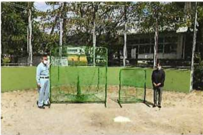
R4.9.9 黒潮支部:伊与喜小学校 角型ネット(2種類)寄贈