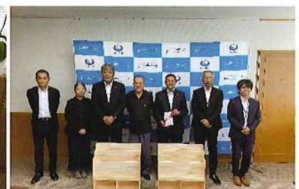
R5.9.1 中村支部:市内保育所へ木製の絵本棚(10台)寄贈