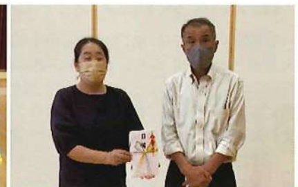
R4.9.30 西土佐支部:川崎保育所へカラー運動棒他寄贈