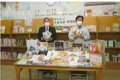
R4.10.13 大月支部:町立図書館へ図書を寄贈