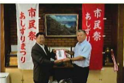
R5.7.26 土佐清水支部:市民祭あしずりまつり実行委員会へのぼり旗(100枚)寄贈