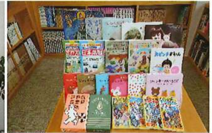
R4.10.25 三原支部:三原村中央公民館図書室へ図書の寄贈