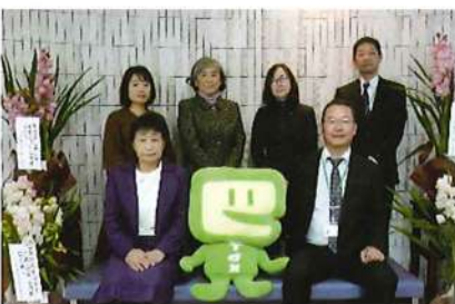
R5.2.13 女性部会:確定申告会場へ鉢花贈呈