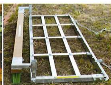
R5.9.1 西土佐支部:西土佐中学校へグラウンドならし(1台)寄贈