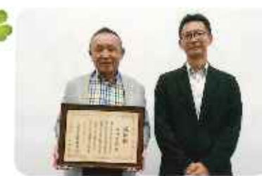
香椎税務署長 感謝状