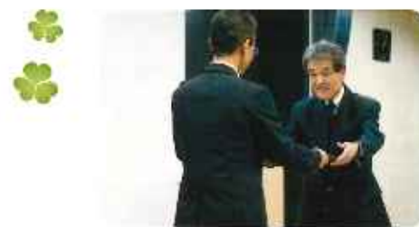
国税庁長官 納税表彰