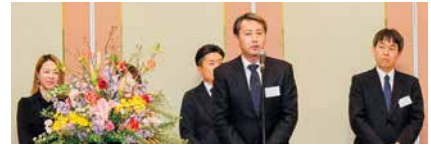
新春交歓会 令和5年度新会員ご紹介