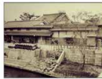
大同生命の礎を築いた 大坂の豪商「加島屋」