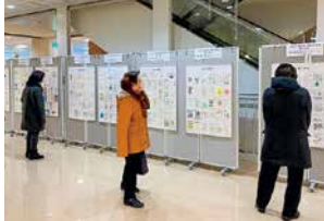
ヒロ口3階 「コミュニケーションゾーン」

1月11日～15日までヒロ口3階「コミュニケーションゾーン」、2月14日～3月15日まで弘前市立観光館「確定申告会場」において弘前地区全作品311点の展示を行いました。