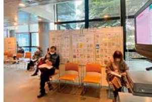
弘前市立観光館「確定申告会場」