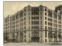
旧肥後橋本社ビル (設計:W・M・ウォーリス)