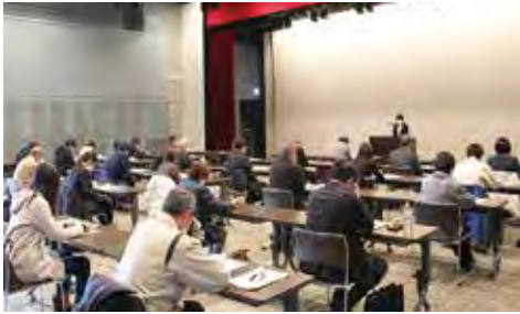
令和5年1月19日（木）決算法人説明会 （1月～3月決算先対象）