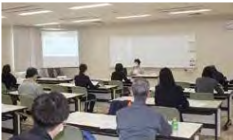
令和5年2月17日（金）「改正育児介護休業法の概要 とハラスメント防止対策講座」