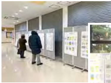
ヒロロ3階 「コミュニケーションゾーン」

1月12日～16日までヒロロ3階「コミュニケーションゾーン」 2月14日～3月15日まで弘前市立観光館「確定申告会場」において弘前地区全作品274点の展示を行いました。