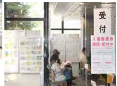
弘前市立観光館「確定申告会場」