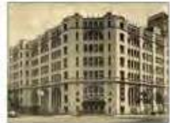
旧肥後橋本社ビル (設計:W・M・ウォーリス)