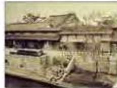
大同生命の礎を築いた 大坂の豪商「加島屋」