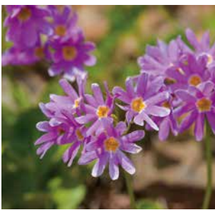
ミチノクコザクラソウ

堀江 ないことはないんですが…あまり考えない…。ちょっと嬉しかったことは、岩木山で「ミチノクコザクラソウ」に出会った時です。感動しました。岩木山の9合目あたりに咲いている花ですが、雪のところにもちよこつと咲いているんです。山に咲く花は、上から下に雪とともに降りてくるんですよ。