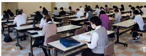
9/6 改正電子帳簿保存法・令和4年度税制改正セミナー