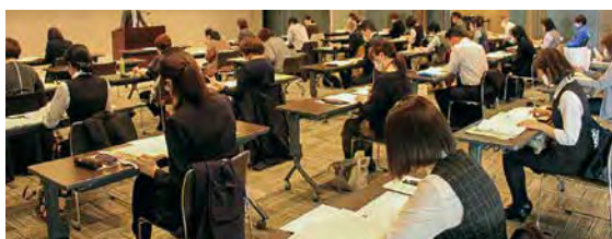
11/22 令和4年年末調整説明会