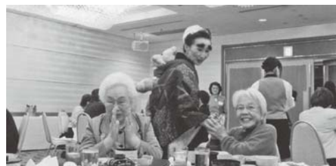
懇親会でのひとこま