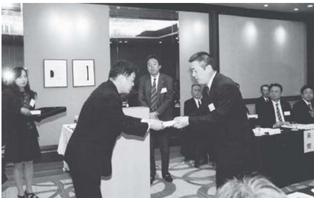
卒業者に記念品贈呈

また、平成25年開催予定の第27回全国青年の集い広島大会に向かって役員一同幅広い活動を企画、推進することとなった。