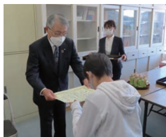
牛田小学校 (会長賞)