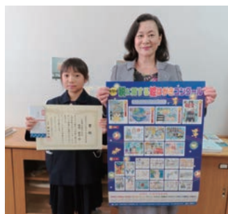
袋町小学校 (女性部会長賞)