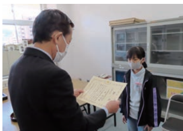
牛田小学校 (広島東税務署長賞)