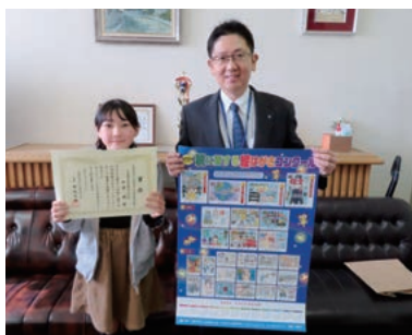
早稲田小学校 (青年部会長賞)