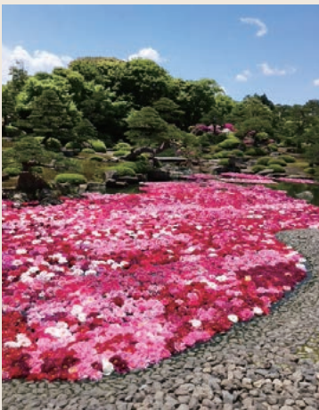
大山(伯耆富士)、由志園の池泉牡丹