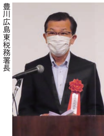
豊川広島東税務署長

今年度の活動方針としては、法人会活動の原点である「税」に関する活動に軸足を置きながら、会員の研鑽、納税意識の高揚に努めるとともに、企業経営及び地域社会の健全な発展に貢献していくことが盛り込まれた。