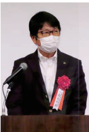
大同生命保険(株) 波多野支社長