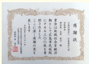
◆社会貢献◆ 広島市民病院にタオル寄贈

女性部会では、広島市の花と緑のまちづくり「四季の花プランター設置事業」に協賛し、広島駅前大橋のプランターに四季折々の草花を植栽して、道行く人に和らぎと潤いを与えている。写真は、夏から秋にかけて見ごろを迎える花への植替えが行われた後のもの。