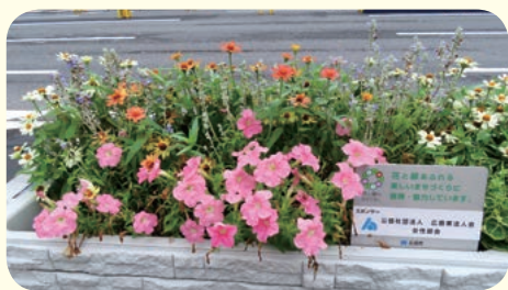
◆社会貢献◆ 四季の花でおもてなし