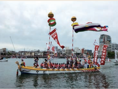
上：日本の夕陽百選に選ばれた宍道湖の夕日 下：松江ホーランエンヤ(2019年)