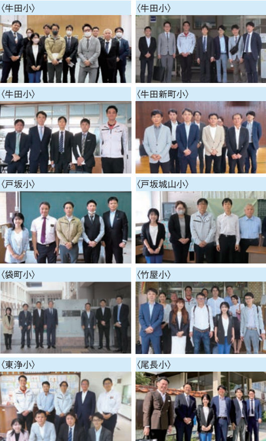
※( )内は開催小学校、下は講師名(敬称略)

青年部会では、小学6年生の児童を対象に、税の使い道や必要性などについて授業を行う「租税教室」を工夫しながら実施しています。将来を担う子供たちは、税に関して様々なことを租税教室から学んでおり、児童から寄せられたメッセージの一部を紹介します。