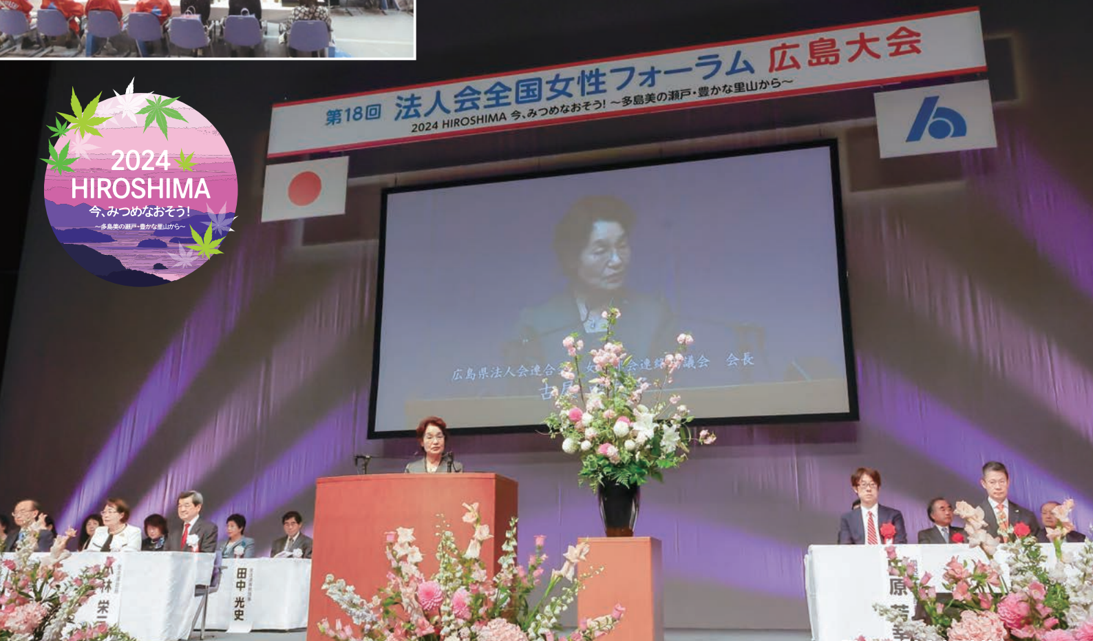
「第18回法人会全国女性フォーラム 広島大会」の様子

第18回 法人会全国女性フォーラム 広島大会 2024 HIROSHIMA 今、みつめなおそう! ~多島美の瀬戸・豊かな里山から~