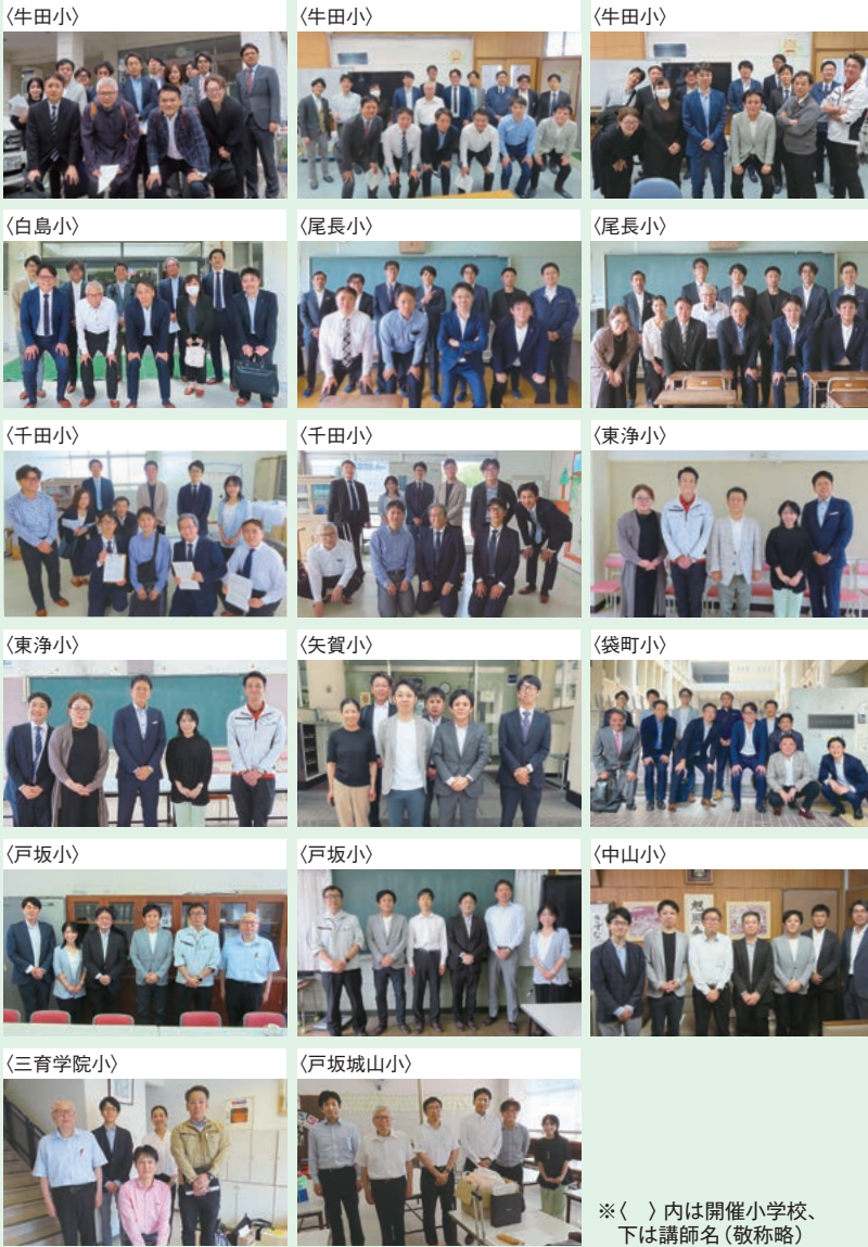
※〈 〉内は開催小学校、 下は講師名(敬称略)