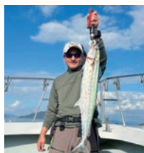
遊漁船 桃兵衛を利用した人 キャッチアンドイートコース