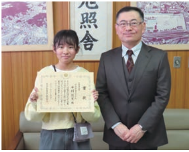
中山小学校(広島東税務署長賞)