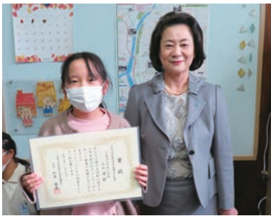
牛田小学校(租税教育推進協議会会長賞)

ン広島に展示されました。 税に関する絵はがきコンクールは国税庁後援事業となっており、将来の日本を背負っていく子供たちに税に対して興味を持ってもらえるよう事業を充実させたいと思います。