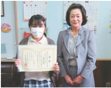
牛田小学校(女性部会長賞)