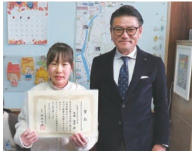
牛田小学校(青年部会長賞)