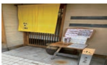
名物メニュー(クエ鍋)