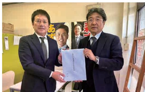
●参議院議員 森本 真治氏