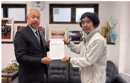
●衆議院議員 斉藤 鉄夫氏

広島北税務署管内の地元選出の国会議員ならびに安芸太田町・北広島町の町長、町議会議員に「令和8年度税制改正に関する提言書」を手渡しました。