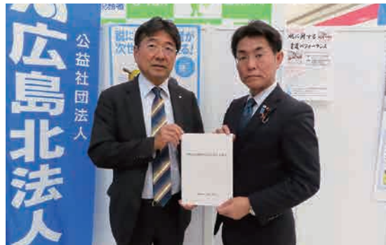
●衆議院議員 石橋 林太郎氏