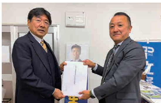
●衆議院議員 東 克哉氏