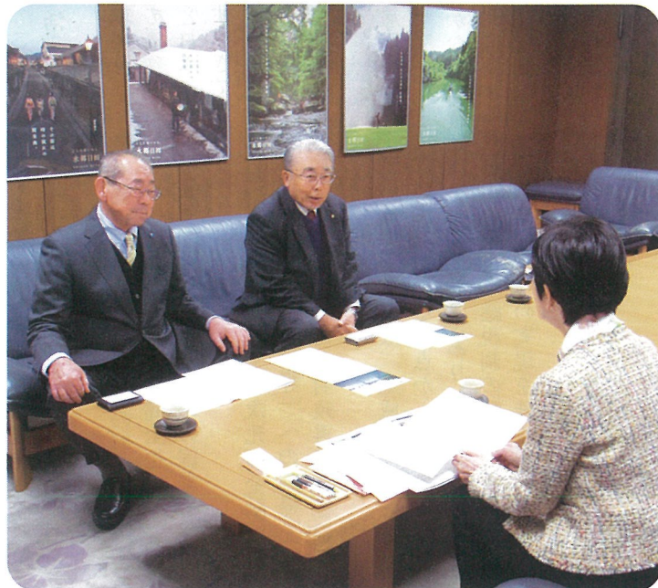
椋野市長への提言

毎年、会員企業から要望のあった内容を全国レベルで取りまとめ、これをもとに「税に関する提言」として、国会議員や知事、市長等に税制改正の要望を行っております。