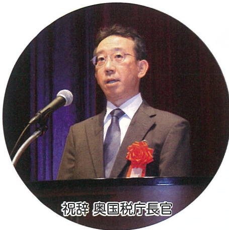
祝辞 奥国税庁長官