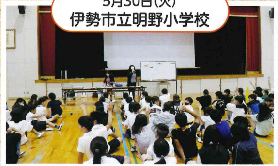
5月30日(火) 伊勢市立明野小学校