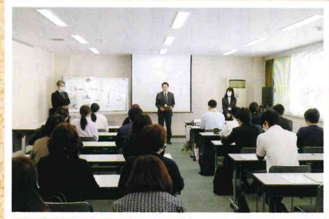
5月9日(火) 講師養成研修