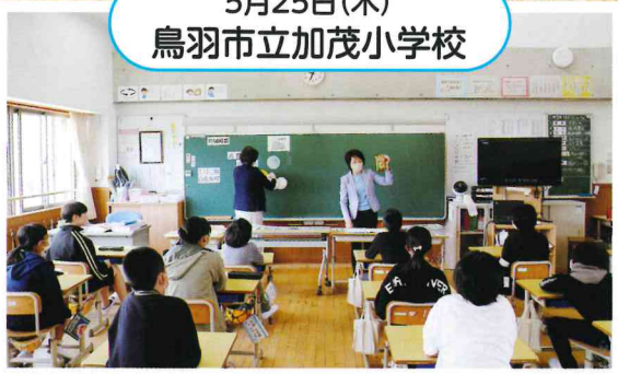
5月25日(木) 鳥羽市立加茂小学校