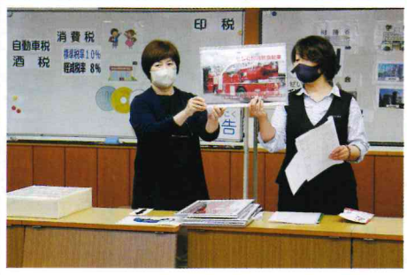
5月24日(水) 事前勉強会