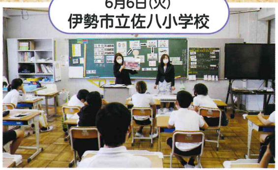
6月6日(火) 伊勢市立佐八小学校